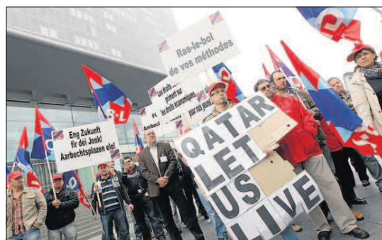
Rund 50 Demonstranten vom OGBL haben vor dem Nachhaltigkeitsministerium gegen den Deal mit Qatar Airways protestiert.